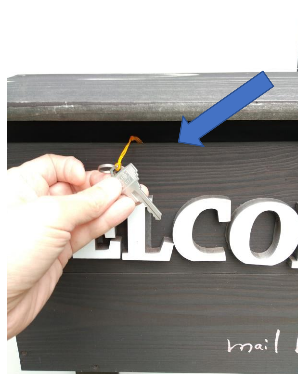
キーを入れる Drop the key