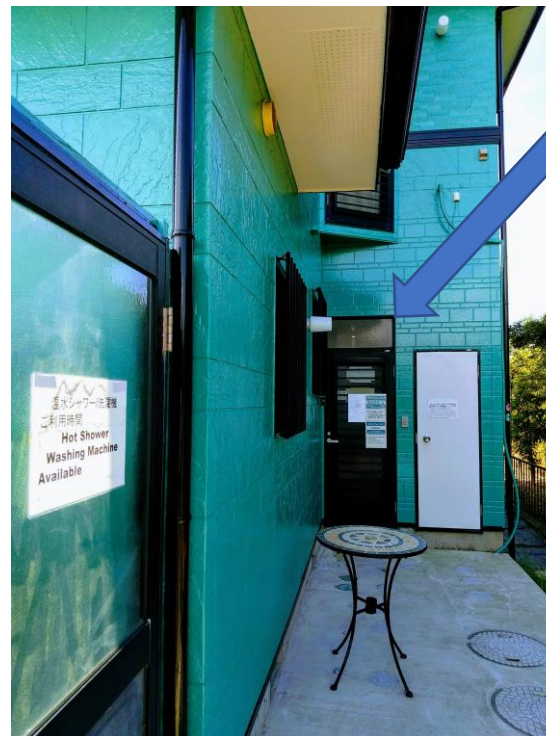
ゲストエントランス Guest entrance